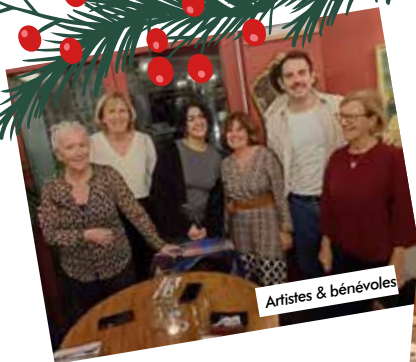
Artistes & bénévoles