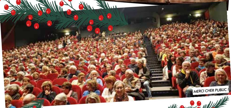
MERCI CHER PUBLIC !