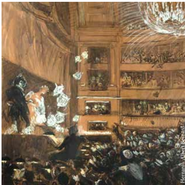
Hernani - Albert Besnard